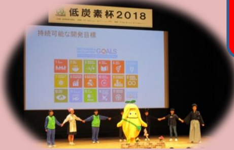
低炭素杯2018 プレゼンの様子