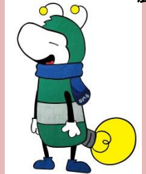
農援隊マスコット ホタルン