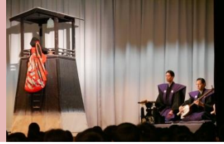
ユネスコスクール講演会「人形浄瑠璃」