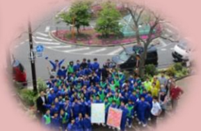
農援隊大岡山花壇整備活動