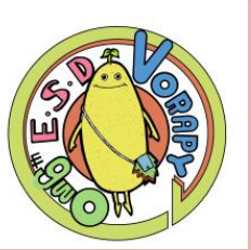
六中ボランティアマスコット ボラピー